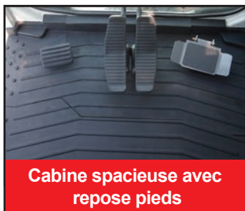
Cabine spacieuse avec repose pieds