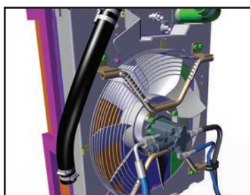
Ventilateur à commande hydraulique