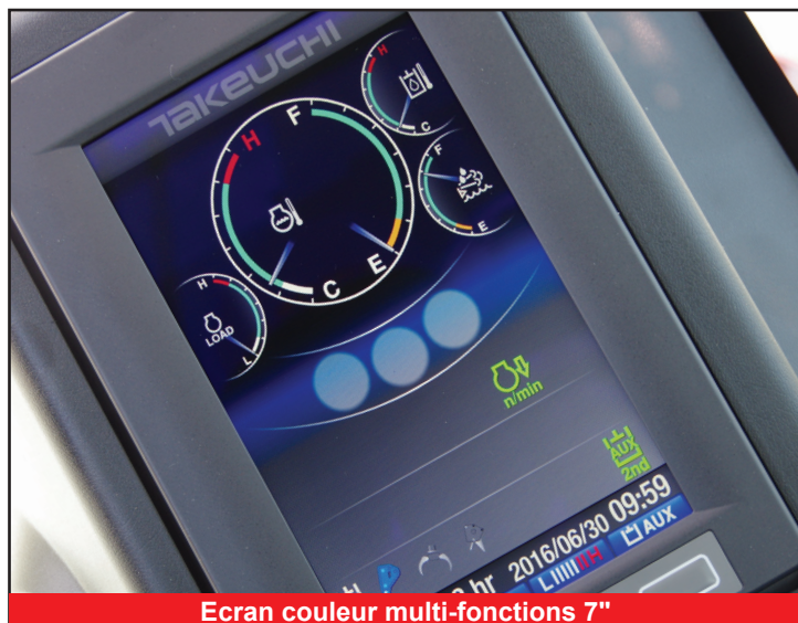
Ecran couleur multi-fonctions 7"