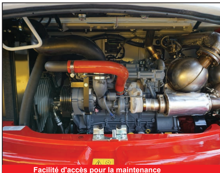
Facilité d'accès pour la maintenance