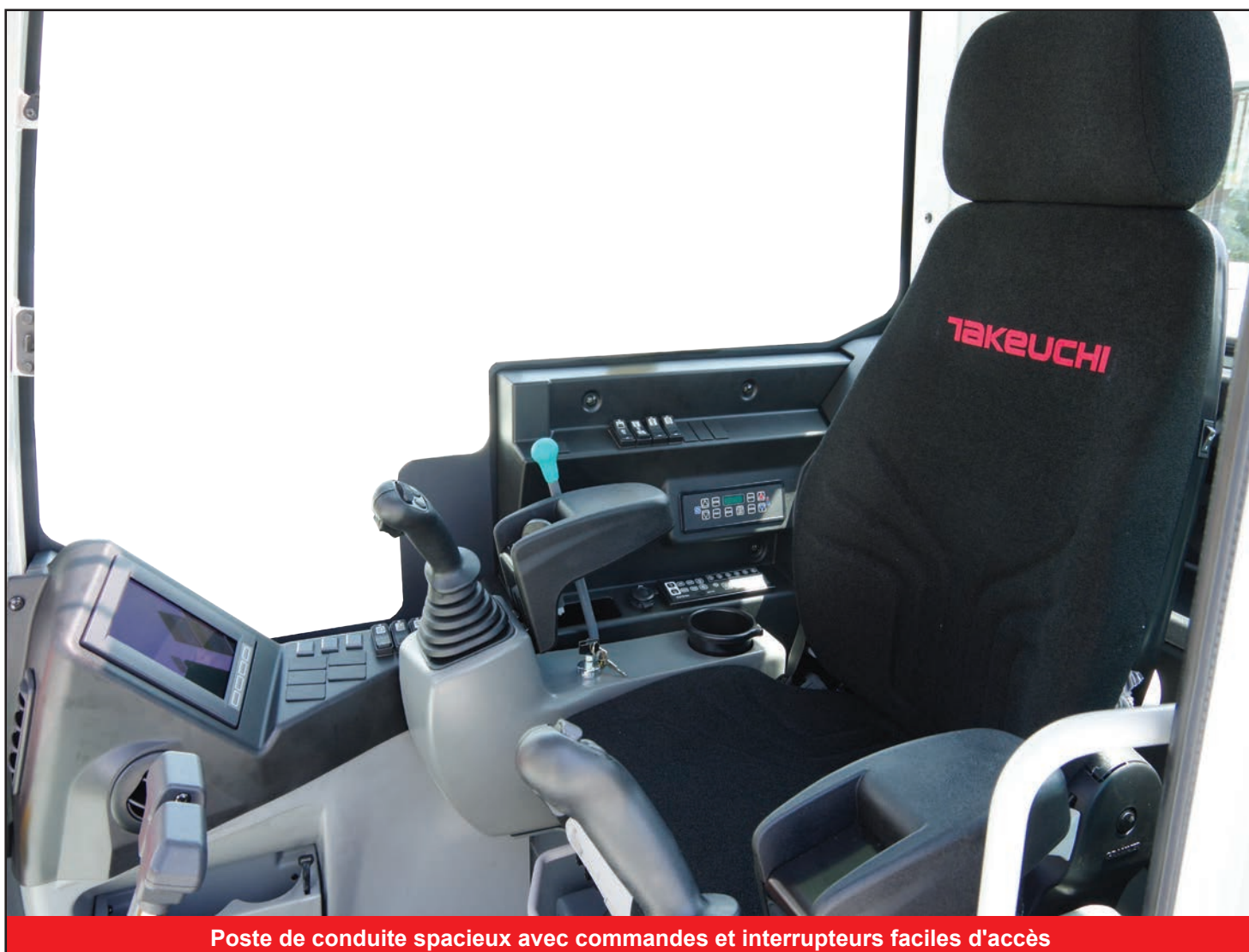
Poste de conduite spacieux avec commandes et interrupteurs faciles d'accès

Les caractéristiques incluent quatre lignes hydrauliques auxiliaires pour une plus grande polyvalence d'accessoires, des clapets de sécurité de flèche et de balancier pour une protection accrue et un grand contrepoids pour plus stabilité.