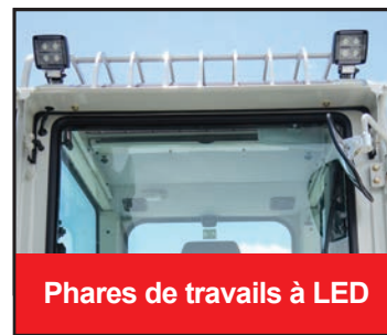
Phares de travaux à LED

La nouvelle pelle hydraulique TB2150 offre d'avantage de fonctionnalités, de performances, de confort et de facilité d'entretien.