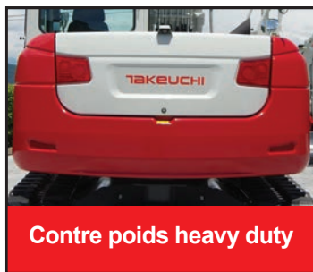
Contre poids heavy duty