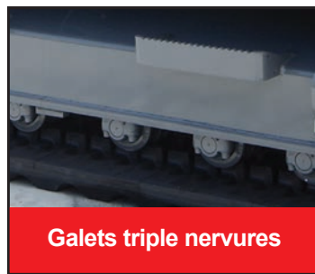
Galets triple nervures