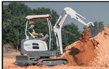
Système de Load Sensing