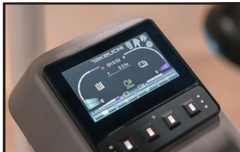
Ecran couleur 4.3"