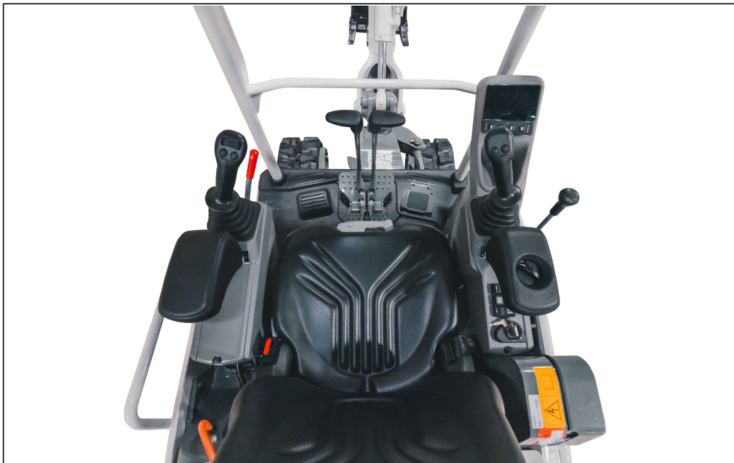
Intérieur spacieux et élégant au style automobile, sans encombrement

Pour les clients souhaitant réduire leur empreinte carbone tout en étant en mesure d'achever leurs travaux à temps et avec un minimum d'arrêts, la Takeuchi TB20e offre une abondance de productivité et une réduction des coûts d'exploitation globaux associés aux équipements de construction traditionnels fonctionnant au diesel.