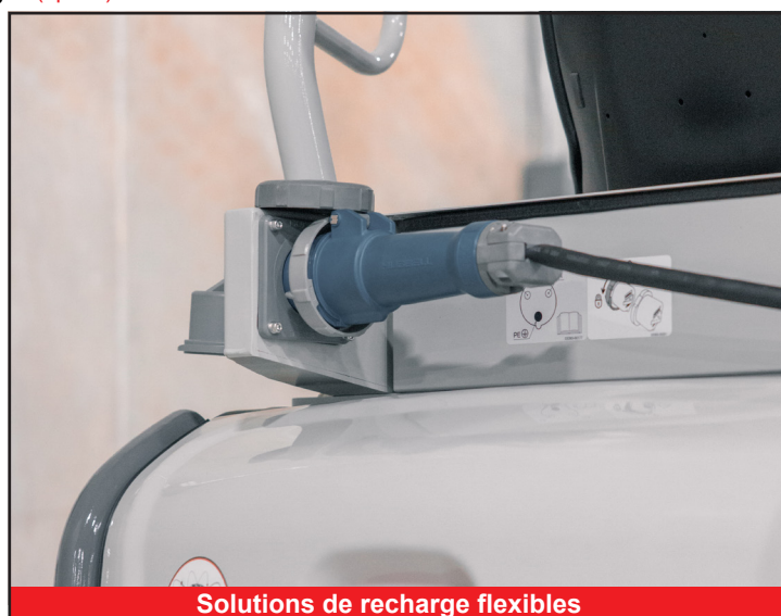
Solutions de recharge flexibles